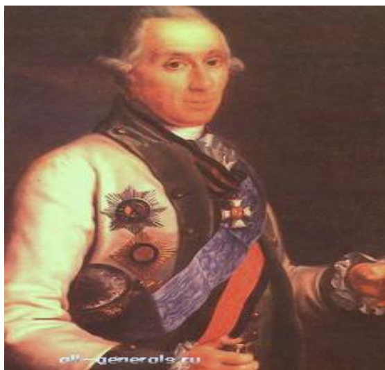
С а м у и л К а р л о в и ч Г р е й г (1735-1788)

важное стратегическое значение крепостью Ачи-Кале (Очаков), павшей 6 декабря 1788 г. В дальнейшем, избрав для своей штаб-квартиры г. Яссы, главнокомандующий руководил оттуда действиями армии и флота. В числе подчиненных Г.А. Потемкина были выдающиеся русские военачальники и флотоводцы А.В. Суворов, Н.В. Репнин, Ф.Ф. Ушаков.