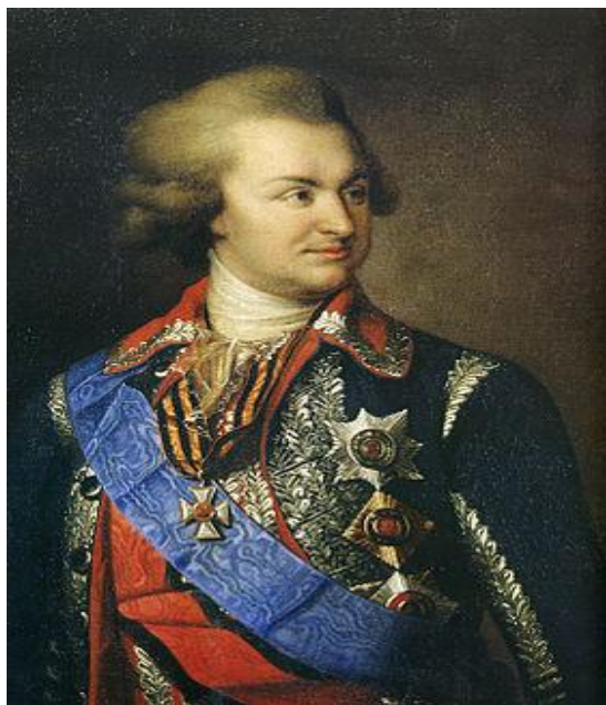
Григорий Александрович Потемкин-Таврический (1739-1791)

Будущий светлейший князь Таврический и генерал-фельдмаршал родился в с. Чижово Духовищенского уезда Смоленской губернии в семье отставного офицера. В 1755 г. поступил на военную службу. В чине вахмистра участвовал в дворцовом перевороте 1762 г. и после воцарения императрицы Екатерины II был произведен в чин подпоручики, награжден придворным званием камер-юнкер. Во время русско-турецкой войны 1768–1774 гг. участвовал в сражениях при Фокшанах, Браилове, Рябой Могиле,