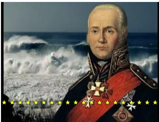
Ф е д о р Ф е д о р о в и ч У ш а к о в (1744-1817)

Его похоронили в Александро-Невской лавре, где на надгробии была высечена надпись: «Здесь лежит Суворов».