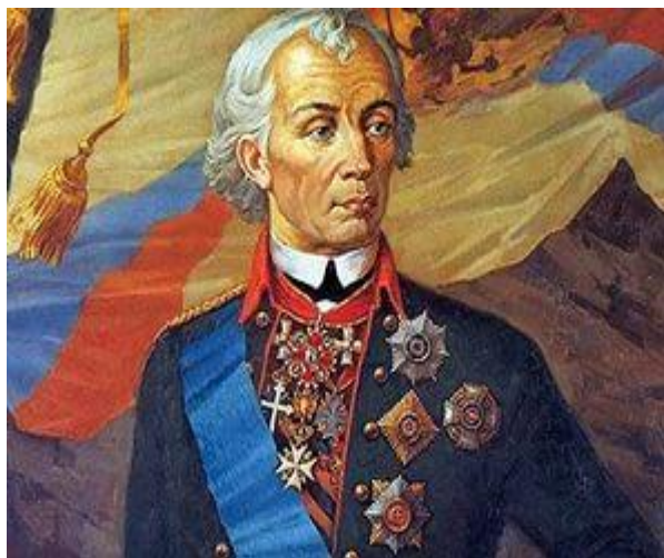
Александр Васильевич Суворов (1730-1800)

службу в русский флот зачислен гардемаринем в 1742 г. В первый офицерский чин мичмана произведен в 1745 г. В 1764 г. назначен начальником экспедиции из трех кораблей для отыскания морского пути вдоль побережья Северного Ледовитого океана из Архангельска к Берингову проливу и далее к Камчатке. Дважды, в 1765 и 1766 гг., пытался он выполнить поставленную перед ним задачу, но обе экспедиции Чичагова попытки пройти Северным морским путем окончились безрезультатно. Однако ему удалось достичь высоких полярных широт (в первом случае 80°26' с. ш., во втором — 80°30' с. ш.). Во время русско-турецкой войны 1768-1774 гг. контр-адмирал Чичагов командовал отрядом кораблей Донской флотилии, оборонявшим Керченский пролив. В 1775 г. произведен в чин вице-адмирала и назначен членом Адмиралтейств-коллегии, в 1782 г. произведен в чин адмирала. Во время русско-шведской войны 1788-1790 гг. командовал Балтийским флотом, руководил действиями русских эскадр в Эландском и Ревельском морских сражениях. После прорыва шведского флота из Выборга в ночь на 22 июня 1790 г. возглавил преследование кораблей противника, в ходе которого русские моряки уничтожили и захватили 7 линейных кораблей, 3 фрегата, 6 катеров, 5 галер, 21 канонерскую лодку, 3 брандера, 16 транспортных судов и 3 бота. За эту победу награжден орденом Св. Георгия 1-й ст. С 1797 г. – в отставке.